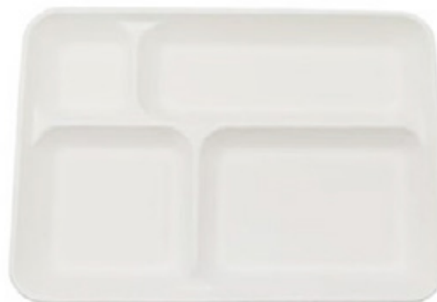
EST045R VASSOIO SELF 4 SCOMP. dimensioni sizes 37x27h3,5 cm temp. max RIC. CARTA pz/conf pcs/pack 25 pz/cart pcs/box 250