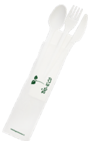
1VP376 BIS + TOV. 2 VELI (forch/colt) 75-80° gr 3,5 BIS+NAPKIN 2 LAYER (fork/knife) 75-80° gr 3,5 pz/cart pcs/box 500