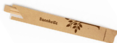
GWB2518A BACCHETTE BAMBOO INCARTATE dimensioni size 210x4,8 mm pz/conf pcs/pack 100 pz/cart pcs/box 2000