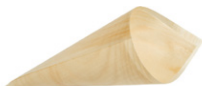
GW3029 CONO PALMA dimensioni size 125x85 mm pz/conf pcs/pack 50 pz/cart pcs/box 1000