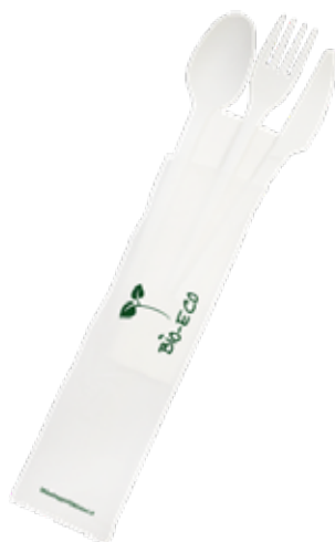
1VP379 TRIS + TOV. 2 VELI (forch/colt/cucch) 75-80° gr 3,5 TRIS+NAPKIN 2 LAYER (fork/knife/spoon) 75-80° gr 3,5 pz/cart pcs/box 500