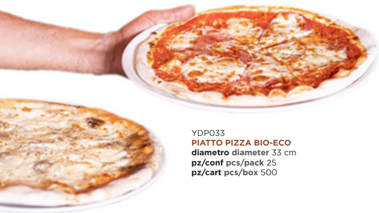
YDP033 PIATTO PIZZA BIO-ECO diametro diameter 33 cm pz/conf pcs/pack 25 pz/cart pcs/box 500