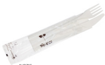
1VP316 BIS C-PLA 4 gr cad. + TOVAGLIOLO (forchetta/coltello/tovagliolo 2 veli) (fork/knife/napkin 2 layers) pz/conf pcs/pack 50 pz/cart pcs/box 250