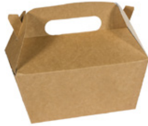
0310271 CARRYMEAL KID CON MANICO dimensioni inf. bottom size *165x100h90 mm dimensioni sup. top size *205x140 mm pz/conf pcs/pack 50 pz/cart pcs/box 300