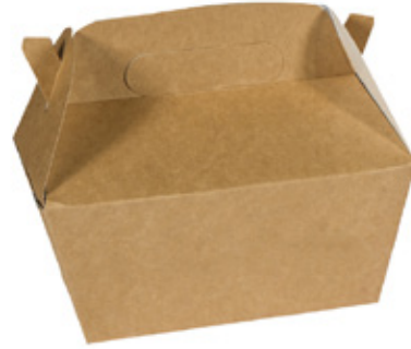
0310273 CARRYMEAL CON MANICO dimensioni inf. bottom size *228x122h97 mm dimensioni sup. top size *265x165 mm pz/conf pcs/pack 50 pz/cart pcs/box 150

* rif. dimensioni parte più larga reference size: wider part